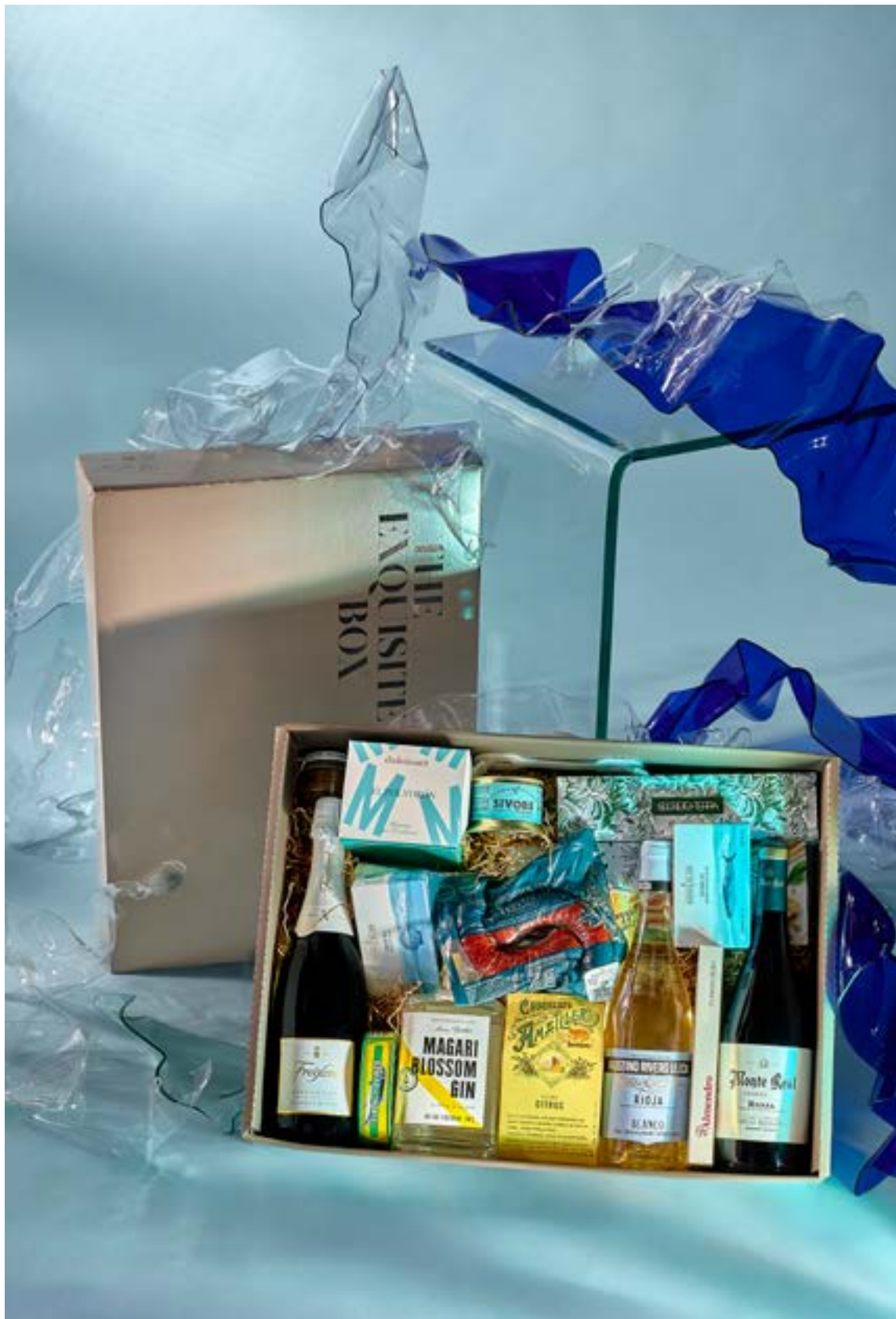
LOTE THE EXQUISITE BOX 309 REF. 4D2CTEB309 - 80,27€ 91,18€ IVA INC.