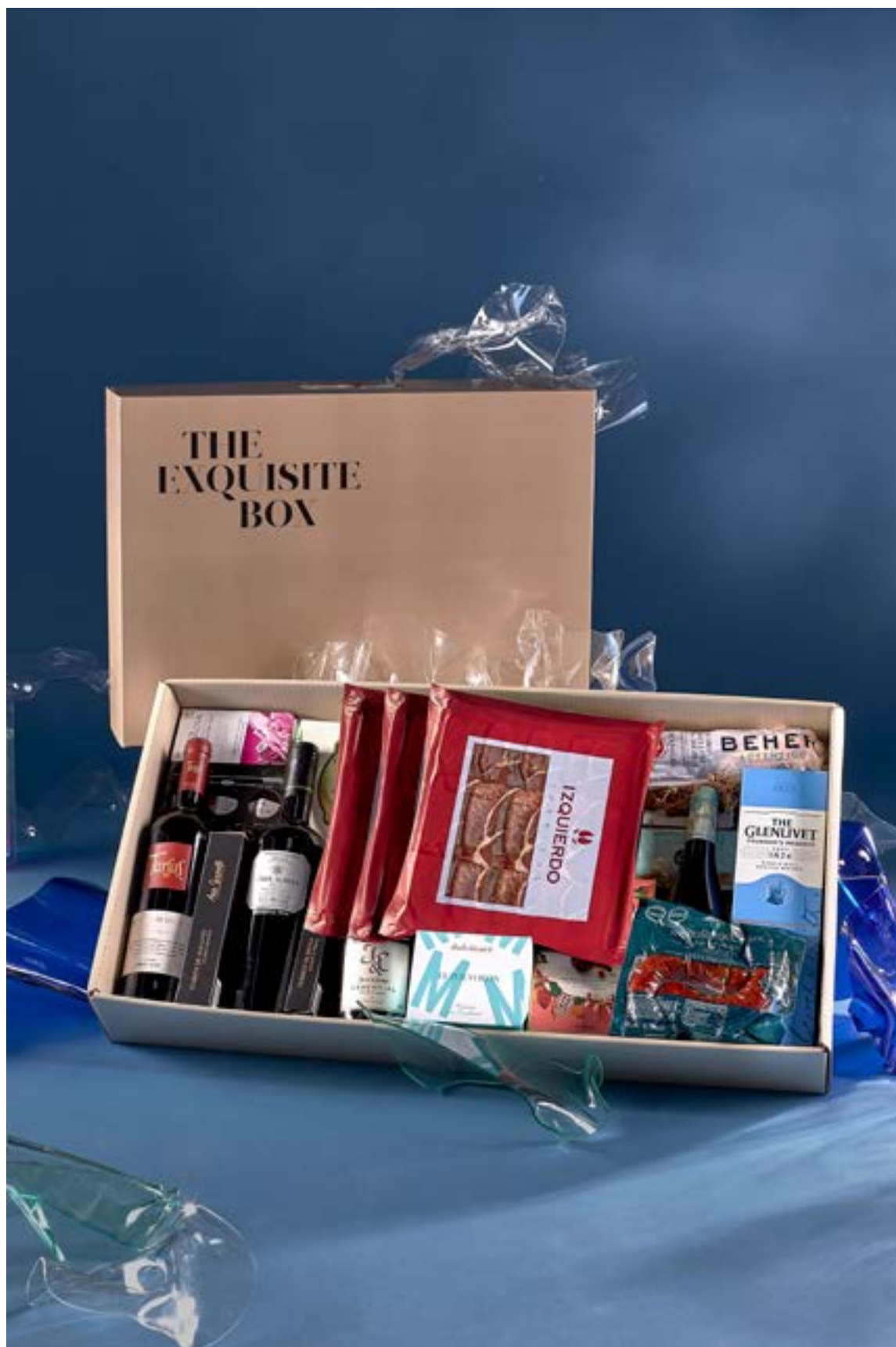
LOTE THE EXQUISITE BOX 304 REF. 4D2CTEB304 - 199,36€ 225,68€ IVA INC.