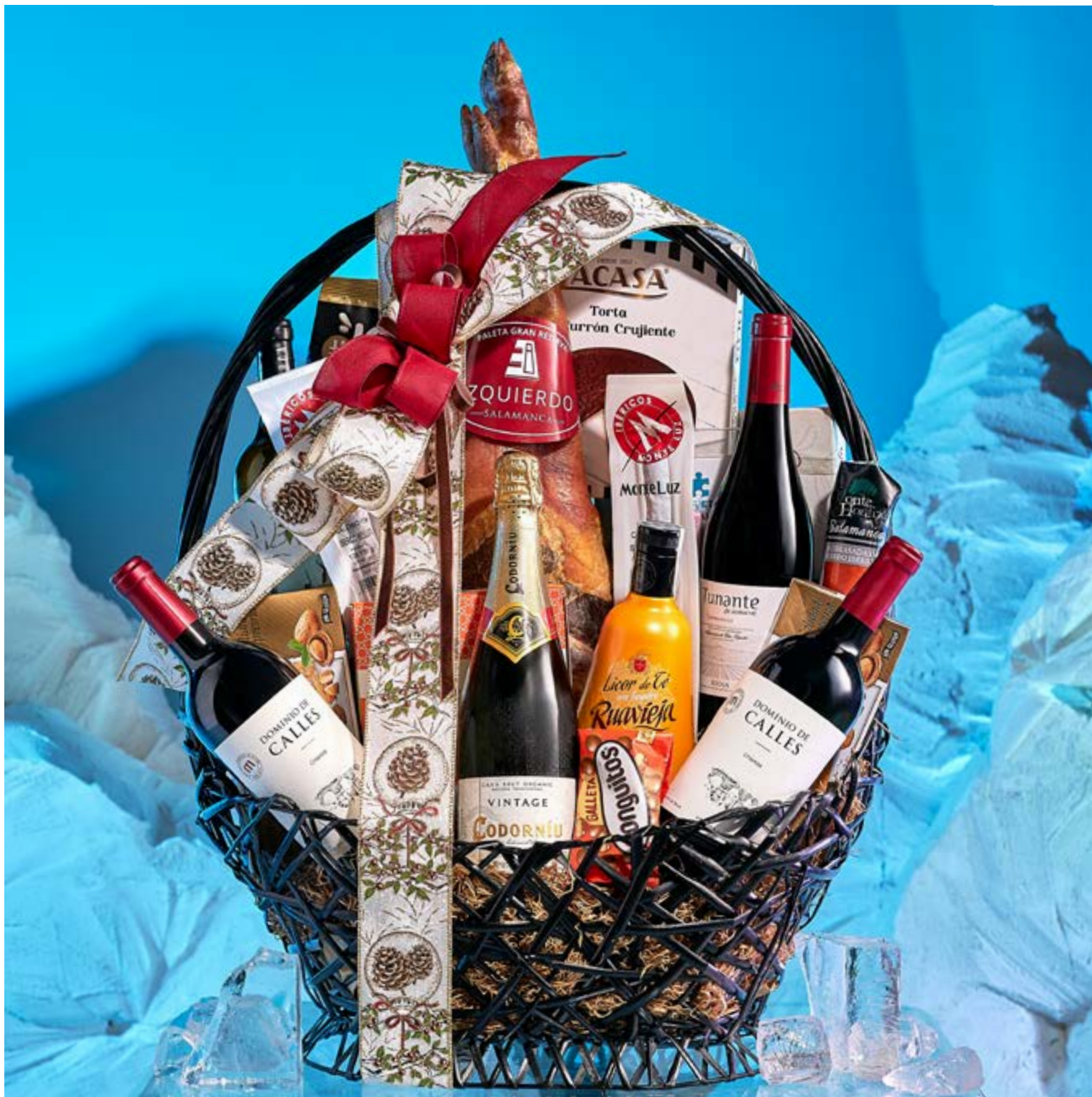
La cesta 502 se presenta decorada con cintas y envuelta en tul.