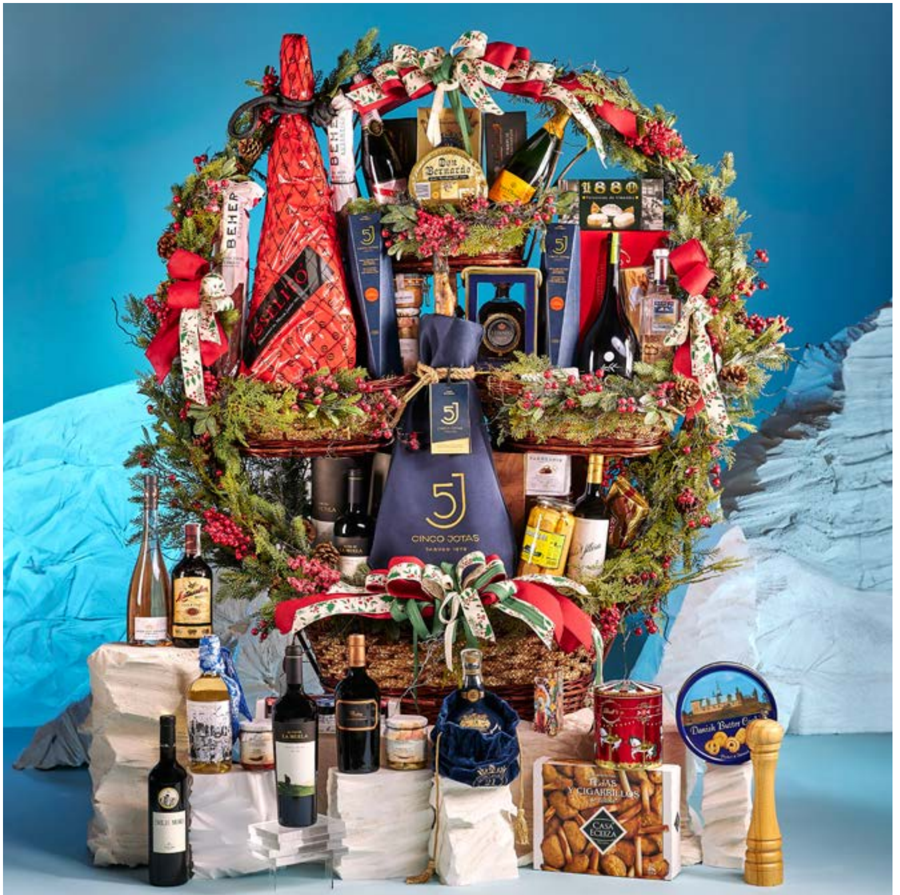
La cesta 512 se presenta decorada con cintas y envuelta en tul.