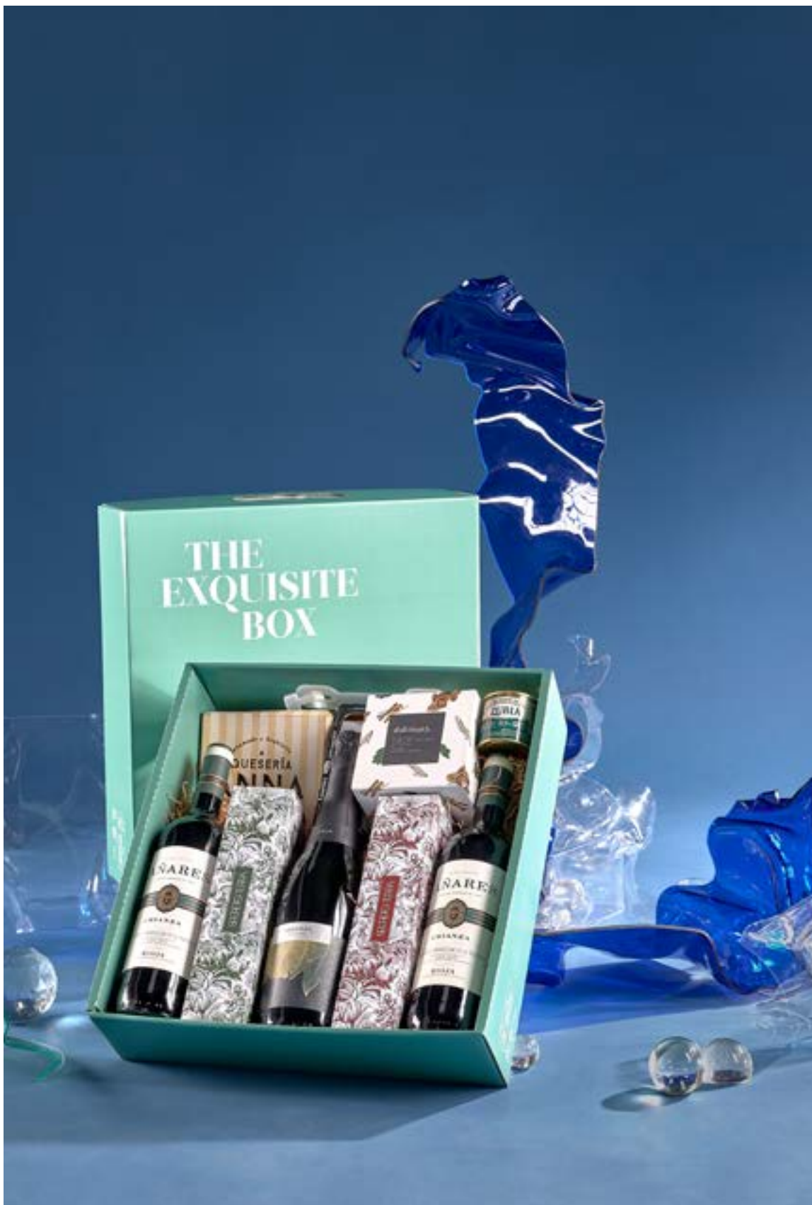
LOTE THE EXQUISITE BOX 322 REF. 4D2CTEB322 - 38,50€ 43,54€ IVA INC.