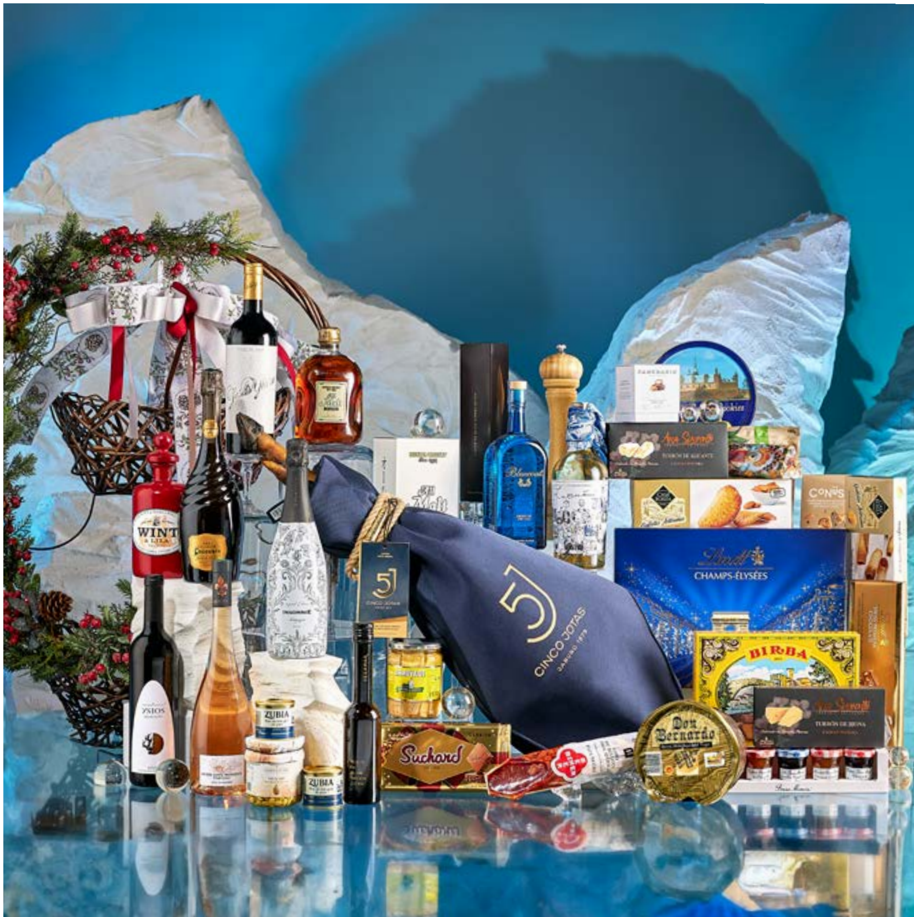
La cesta 510 se presenta decorada con cintas y envuelta en tul.