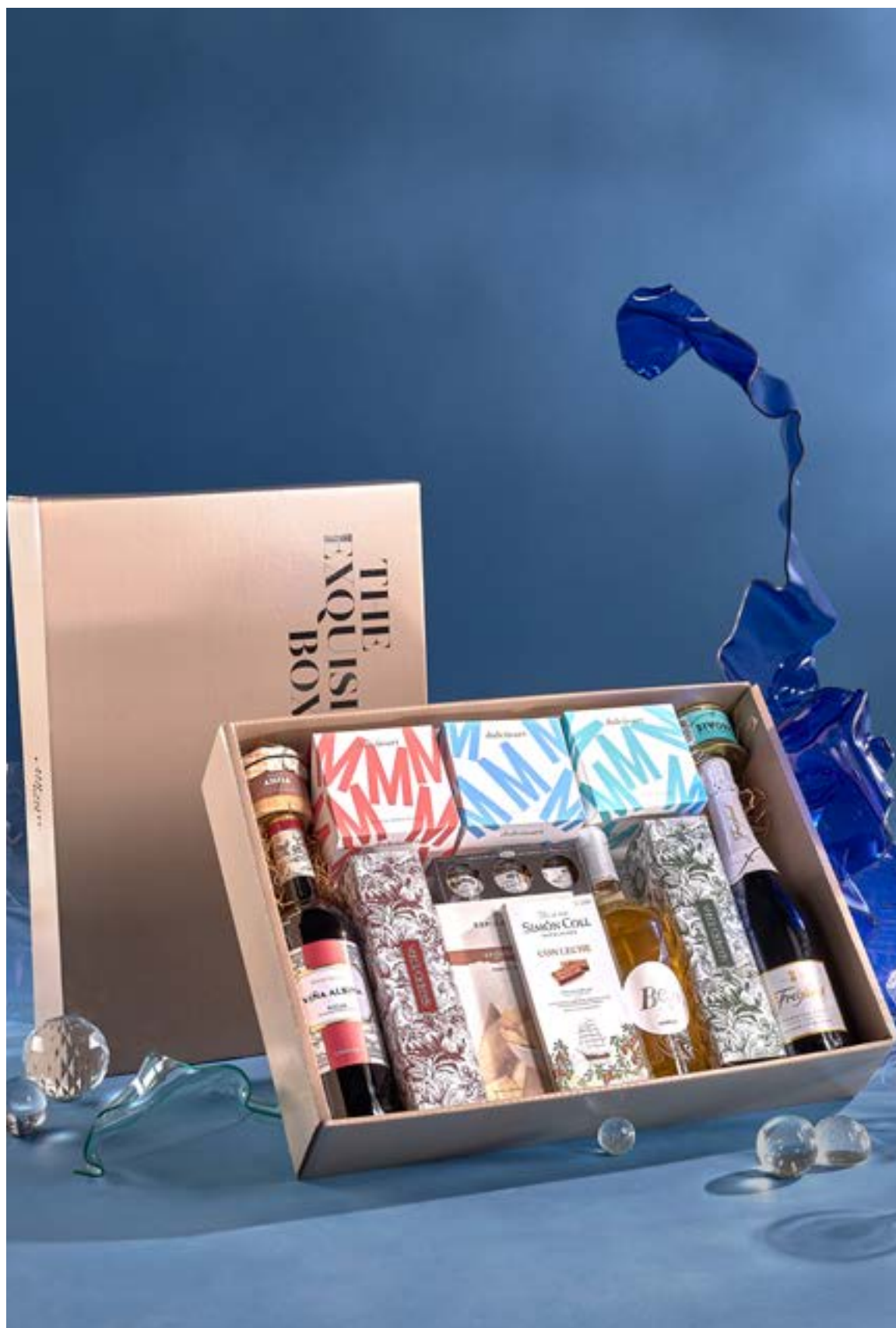
LOTE THE EXQUISITE BOX 320 REF. 4D2CTEB320 · 46,92€ 53,33€ IVA INC.