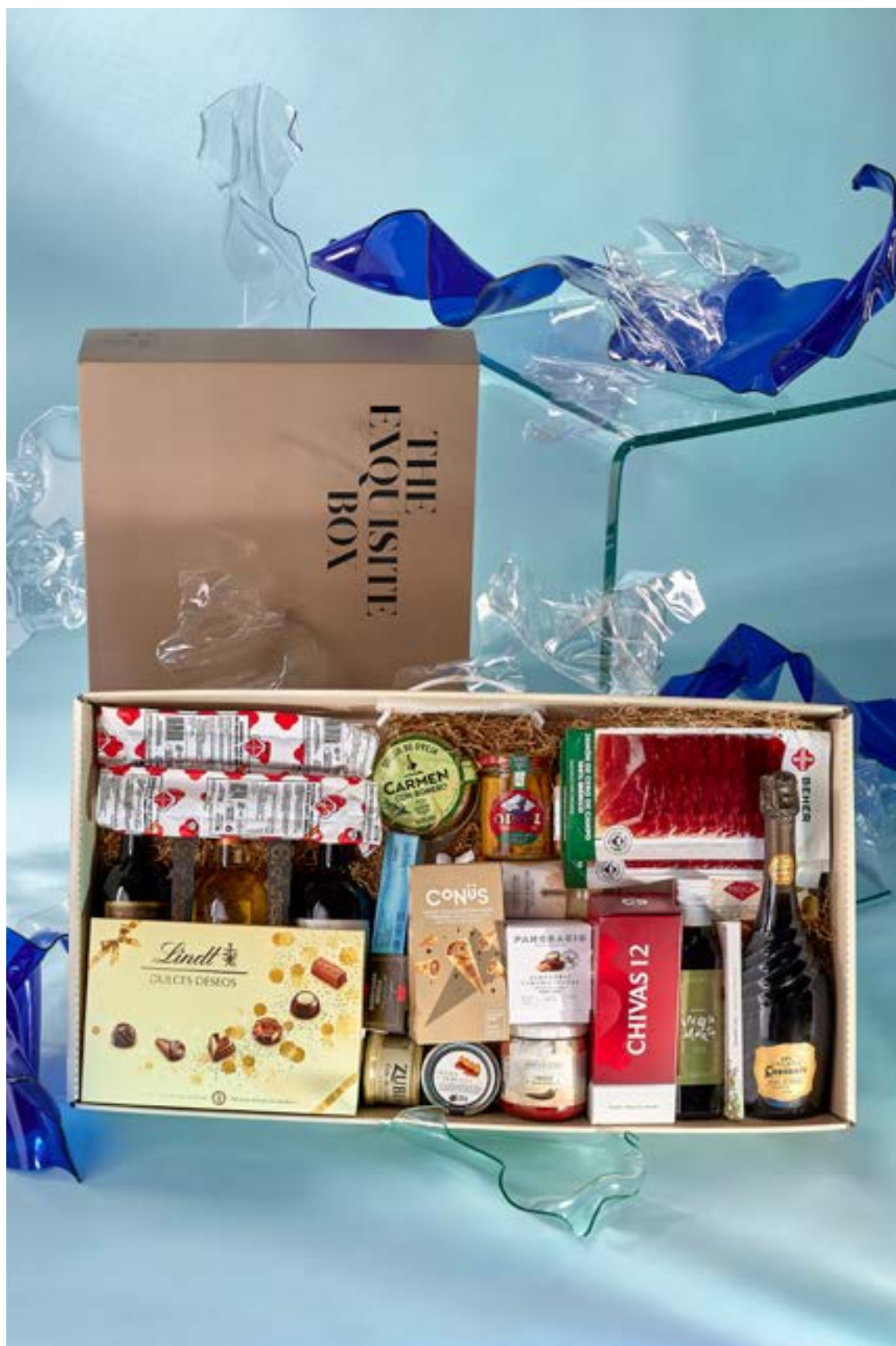
LOTE THE EXQUISITE BOX 305 REF. 4D2CTEB305 - 174,20€ 195,76€ IVA INC.